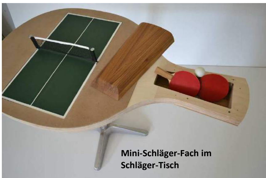
Mini-Schläger-Fach im Schläger-Tisch