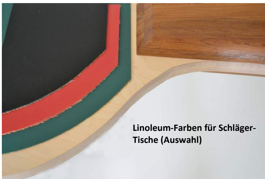
Linoleum-Farben für Schläger-Tische (Auswahl)