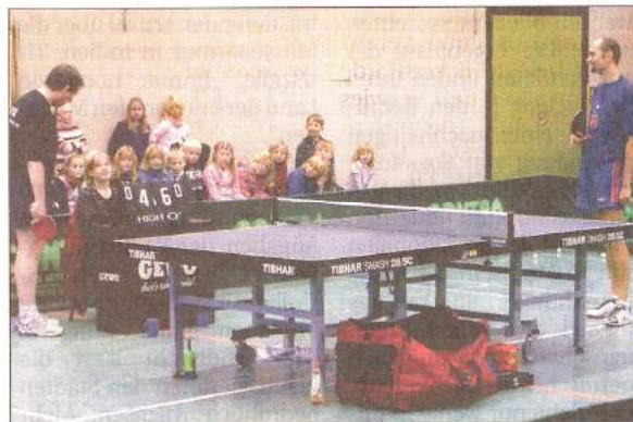
Die Kinder hatten großen Spaß bei den Darbietungen der Profi-Trainer.

Schnupperpässe gibt es weiterhin immer im Training des Vereins, der für Kinder im Grundschulalter neue Trainingszeiten eingerichtet hat: Montags von 14.30 bis 16.30 Uhr sowie freitags von 13.30 bis 15.30 Uhr können alle Mädchen und Jungs im Alter von sieben bis elf Jahren das Nachwuchstraining ausprobieren. Schnupperpässe können auch telefonisch unter 04357/996651 (täglich ab 16 Uhr) angefordert werden.